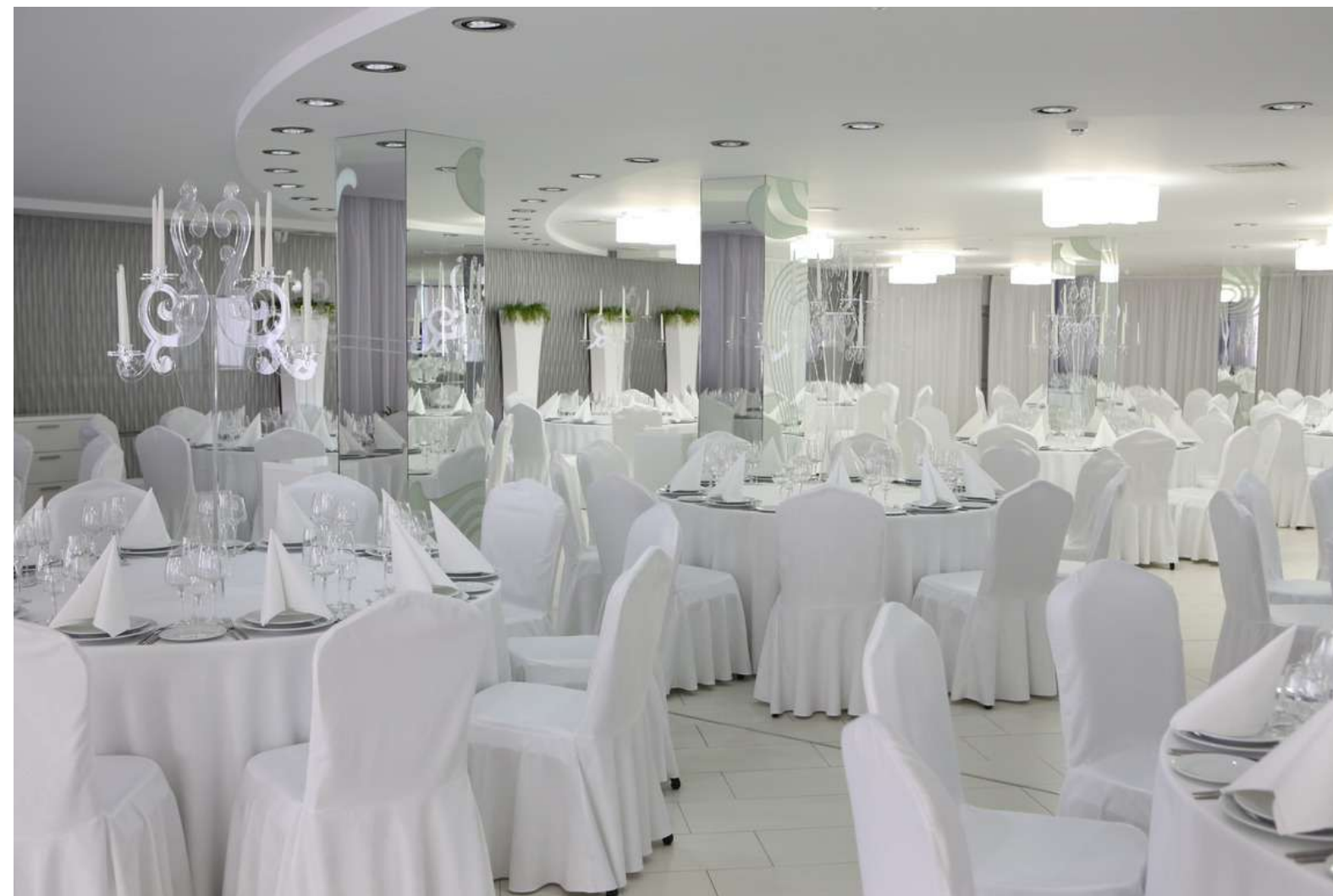
Зал Fusion 80-200 гостей Чеканы, Мирча чел Бэтрын 21