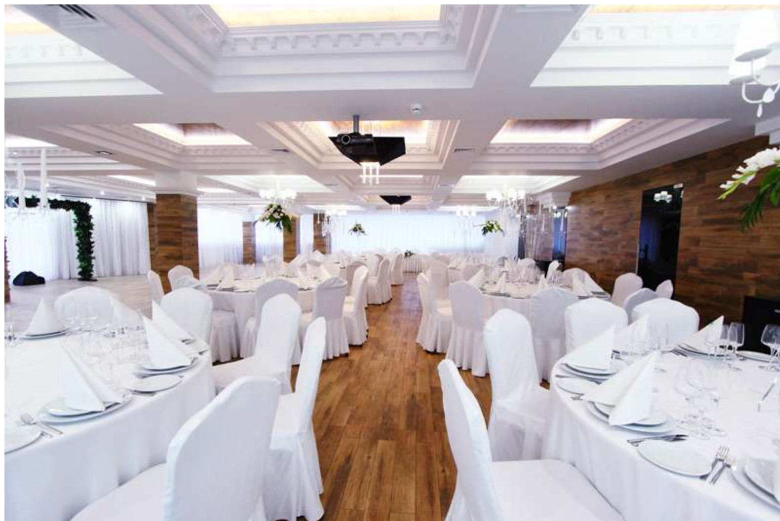
Зал Neoclastic 50-100 гостей Чеканы, Мирча чел Бэтрын 21